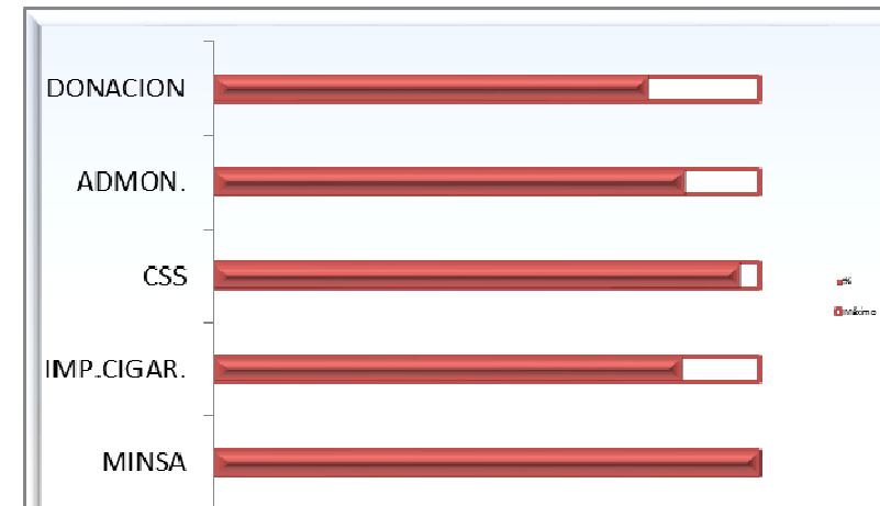
% DE EJECUCIÓN SEGÚN FUENTE DE FINANCIAMIENTO